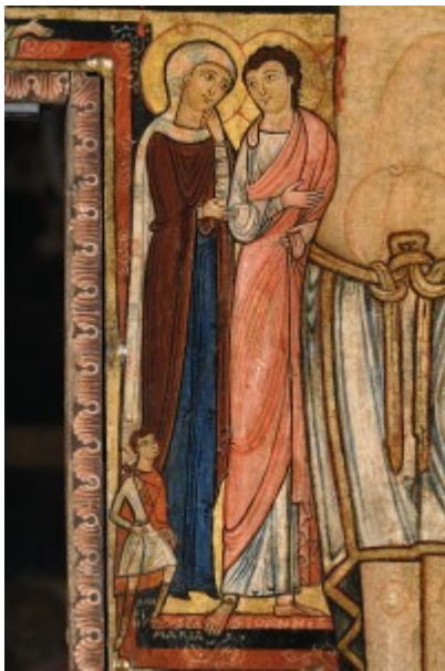
San Giovanni, la Madonna e Longino

Non è possibile identificare con certezza i due santi ai lati della croce, ma non vi è dubbio che essi, comunque, rappresentino l'umanità intera raggiunta dal vangelo, siano essi due evangelisti o due apostoli o il popolo ebraico ed i gentili, riuniti in unità. Il braccio orizzontale della croce spesso viene prolungato con le figure degli evangelisti, ad indicare l'abbraccio del mondo intero da parte del Cristo. E una sottolineatura dell'aspetto cosmico della croce.