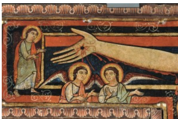
Due angeli ed un santo (un evangelista o un apostolo?)