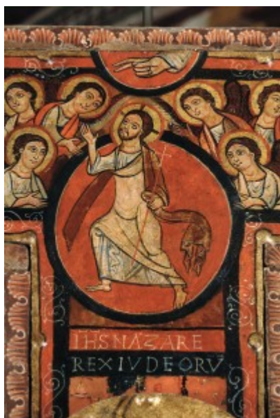
L'Ascensione di Cristo verso la mano del Padre.

Il crocifisso di San Damiano non appartiene ancora al tipo del Christus patiens , del Cristo sofferente, secondo lo stile che si imporrà a partire dal XIII secolo.