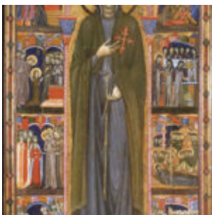
Pala di Santa Chiara